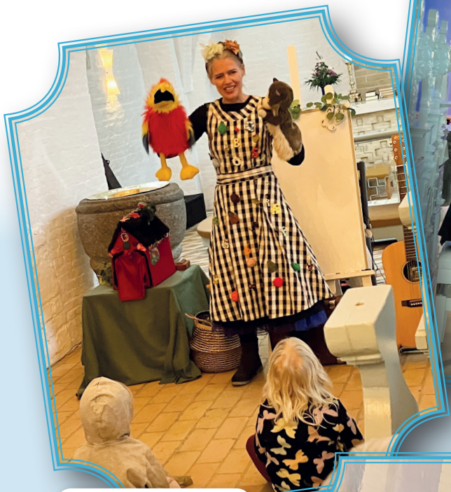
Børnekoncert i Fensmark Kirke