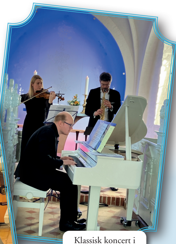
Klassisk koncert i Rislev Kirke